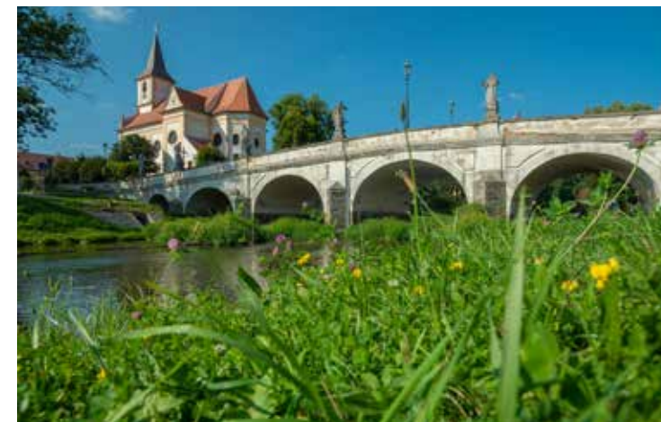
Náměšť nad Oslavou

Druhá světová válka zasáhla také Třebíčsko. K nejvýznamnějším hrdinům odboje během 2. světové války bezesporu patří Jan Kubiš, rodák z Dolních Vilémovic. Společně s Jozefem Gabčíkem spáchal atentát na zastupujícího říšského protektora Reinharda Heydricha. Následné perzekuce se nevyhnuly ani Dolním Vilémovicím. V rodném domě Jana Kubiše se seznámíte s celým příběhem. V letošním roce proběhnou v obci oslavy k 80. výročí atentátu. Třebíčsko se stalo také místem seskoku paraskupiny Spelter. Na místě seskoku poblíž přehrady Dalešice stojí památník. Za podporu parašutistů popravili nacisté několik obyvatel z Boňova