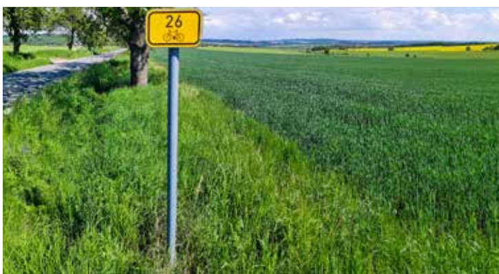
Po cyklotrase č. 26 ujedete v Česku celkem 120 km, posledních 18 km do městečka Raabs an der Thaya pak vede Rakouskem

panství, přijedete do Jemnice. Z návrší u hrobky budete mít město jako na dlani. Zajímavá místa Jemnice spojují tři značené okruhy. K unikátním technickým památkám patří zdejší středověký vodovod s haltýřem. Na první pohled vás jistě upoutají hradby se třemi baštami a dvěma barbakány, stejně jako gotický kostel sv. Víta s podzemními prostory. Hned vedle kostela roste Svatovítská lípa stará asi 800 let. V Jemnici se každoročně koná slavnost Barchan, jejíž historie sahá až do doby Lucemburků. Jemnice se může pyšnit jedním z nejstarších židovských hřbitovů na Moravě, zdejší židovská obec je doložena již ve 14. století. V prostorách místního informačního centra je otevřena půjčovna elektrokol a zakoupíte v něm také čaje od tradičního českého výrobce. O letních prázdninách doporučujeme navštívit přírodní koupací biotop, jediný na Třebíčsku. Během léta je navíc v provozu výletní vlak, který vám usnadní cestu z Moravských Budějovic. Za Jemnicí cyklotrasa opouští Vysočinu a pokračuje do Rakouska, jmenovitě do městečka Raabs an der Thaya.