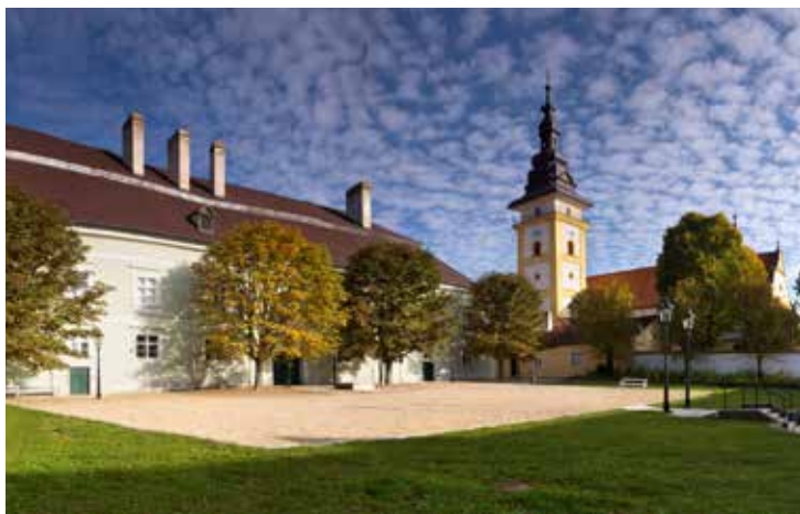
Muzeum řemesel v Moravských Budějovicích