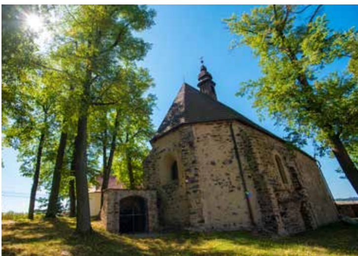
Jemnický kostel sv. Víta