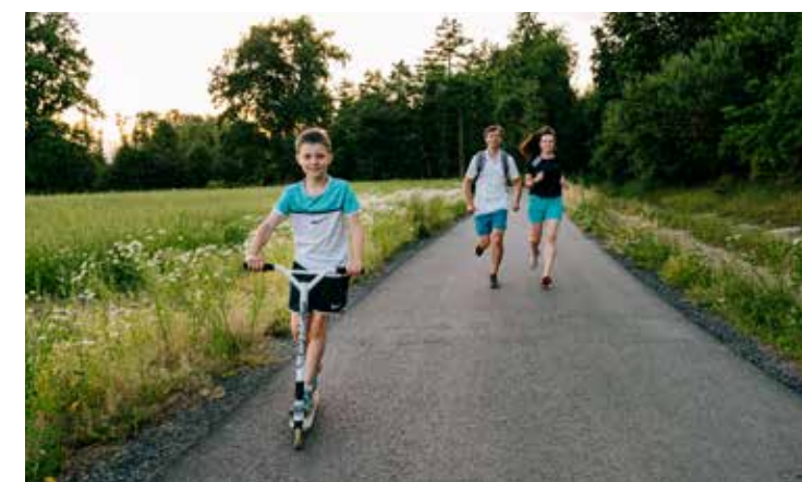
Sportovní okruh Záměš-Bažantnice

Kolem hrobky rodiny Pallavicini, posledních majitelů jemnického