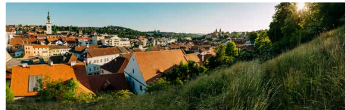
Město Třebíč z Hrádku

Koupaliště láká k osvěžení a odpočinku. Autorem stavby je Bohuslav Fuchs, podle jehož návrhu vznikla také budova spořitelny na Karlově náměstí. Když už budete na hlavním trebičském náměstí, v místním informačním centru využijte služeb TouristPointu a vydejte se ochutnat Třebíč. A na mysl máme nejen gastronomii, ale také památky a zážitky. Třebíč je jedním ze tří míst na Vysočině, která se pyšní zápisem na prestižním listu UNESCO.