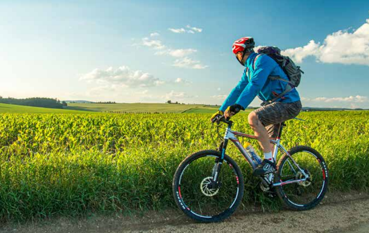
Cyklisté jsou na Třebíčsku vítáni