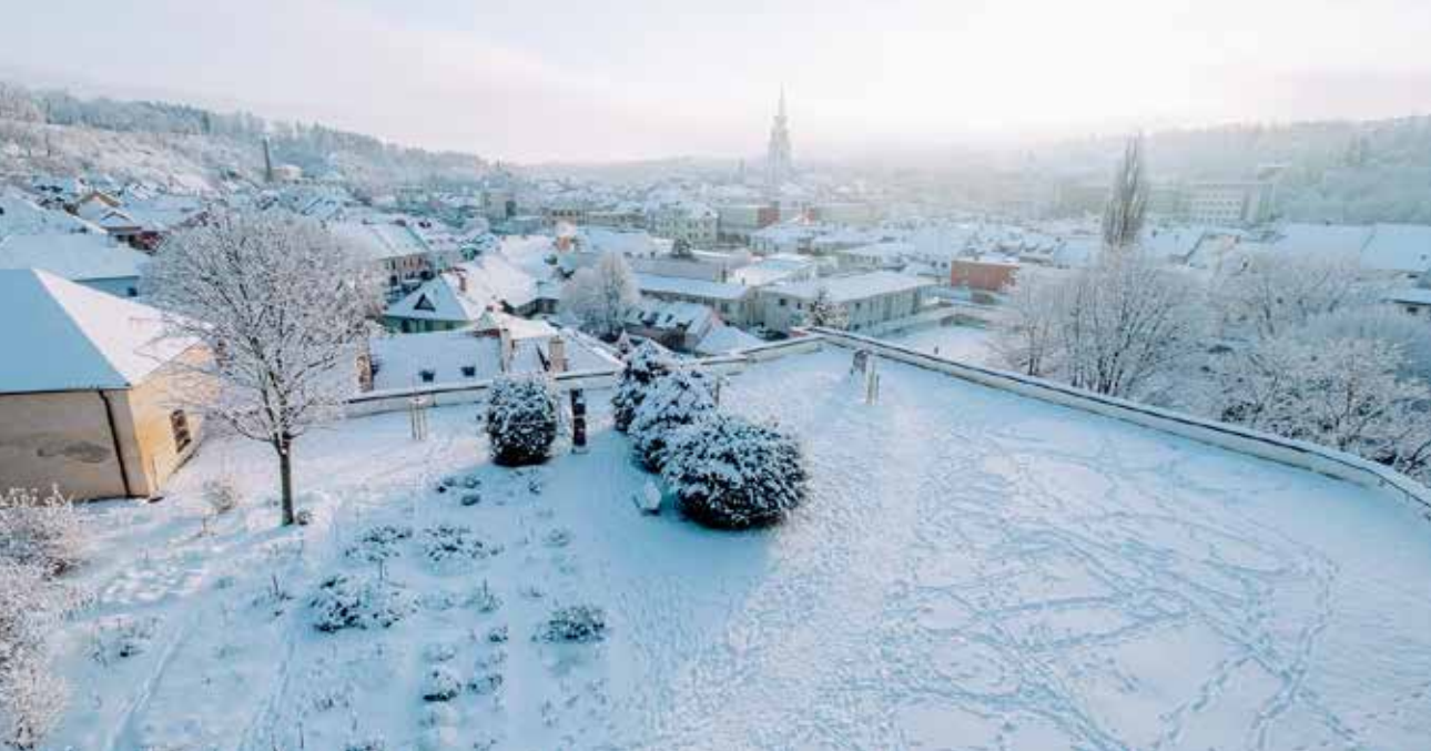
Pohled z trpasličí galerie baziliky sv. Prokopa, foto: Pavel Rybníček