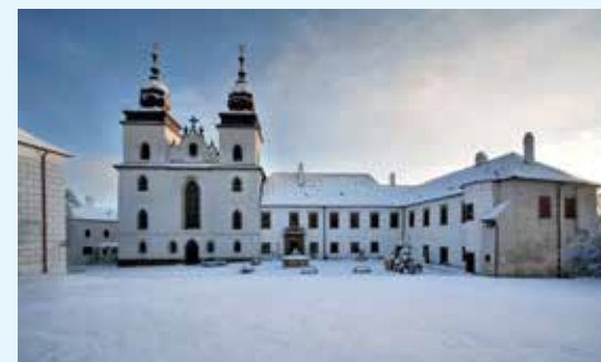
Muzeum Vysočina Třebíč

Na Třebíčsku najdete množství míst, která jsou spojena s odbojem během druhé světové války. Snad