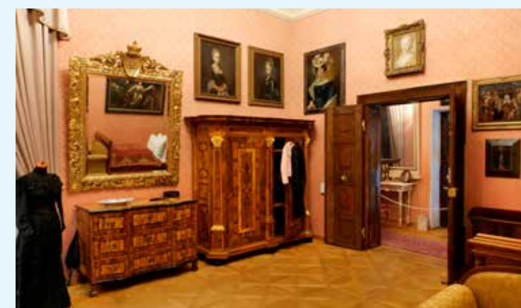
Muzeum Vysočiny Třebíč

kteří vytvořili Čeloud a Hartmann. Kolem roku 1939 bylo v Třebíči asi 300 betlémářů. Betlémy můžete obdivovat v době Vánoc také v trebičských kostelech.