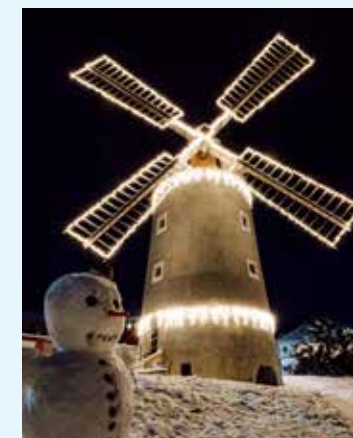
Noční Třebíč

Výzdoba ve městech se rozsvítí po celém Třebíčsku zpravidla první adventní neděli 27. listopadu současně s rozsvícením vánočního stromu. Na první adventní neděli byste měli mít připravený adventní věnec. Přijďte si ho vyrobit v sobotu 26. listopadu