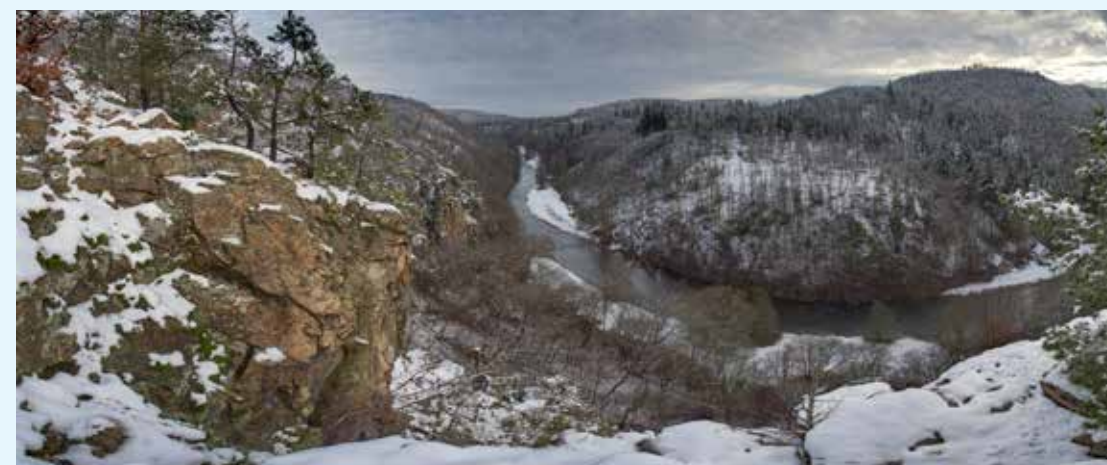
Údolí řeky Jihlavy

Byl vězněn v koncentračním táboře v Buchenwaldu. S odvahou, vynalézavostí a každodenním nasazením vlastního života vytvářel spolu se svými spolupracovníky v Dětském bloku 66 pro své svěřence v nelidských podmínkách nacistického lágru podmínky pro bezpečné přežití. Díky Kalinovu hrdinství mohli zachráněni chlapci ze všech koutů Evropy po válce žít naplno podle svých plánů a představ. Z řady z nich vyrostly světově proslulé osobnosti, úspěšné v mnoha oblastech lidského konání. Expozici v židovské čtvrti dominuje Strom života – umělecké dílo kovářů a pasířů. Jednotlivé lístky stromu nesou jména Kalinou zachráněných chlapců.