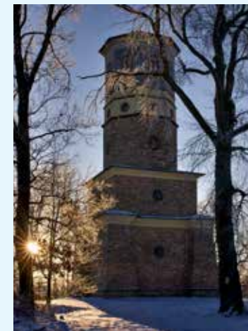
Rohledna Babylon