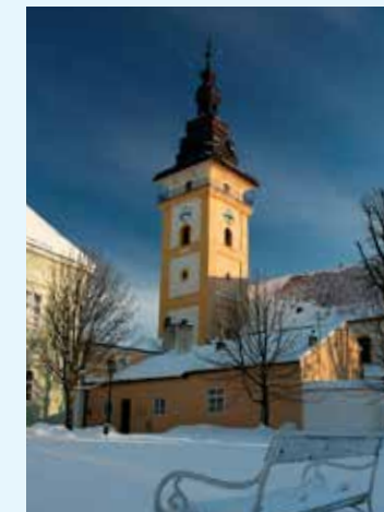
Moravské Budějovice, foto: Pavel Čírtek

Dešov zdobí statky s barevnými fasádami, štíty obrácenými do ulice nebo násvi a bohatě zdobená vjezdová vrata. Dvě města na Třebíčsku spojuje unikátní železnice, technická památka - jemnická dráha. Vede z Moravských Budějovic do Jemnice. Moravské Budějovice leží na někdejší císařské silnici mezi Prahou a Vídní. Zdejší zámek, sídlo muzea, má dvě expozice: Příběh města a zámku a Řemesla a živnosti jihozápadní Moravy. Jemnici, královskému městu s bohatou historií, dominuje již z dálky viditelná věž kostela sv. Stanislava, zářící do okolí bílou fasádou. Nejhezčí výhled na město budete mít z luk SV od města. Ve městě roste lípa, obvod kmene měří 700 cm, spojená s několika pověstmi. Podle jedné z nich byla vysazena na počest pobytu královny Elišky Přemyslovny v Jemnici, podle jiné pověsti kázal pod lípou františkánský mnich Jan Kapistrán, podle kterého je lípa pojmenována. Třebíčsko jako na dlani budete mít z Hanzalova kopečku u Čáslavic. Přímo proti němu se v lesích ukrývá jediný hrad na Třebíčsku - Sádek. Na JV svazích pod hradem