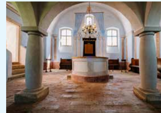
Interier synagogy Police