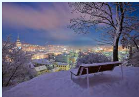
Třebíč – pohled na osvětlené město, foto: Ivo Svoboda