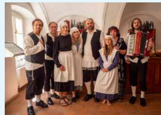
Kostymované prohlídky