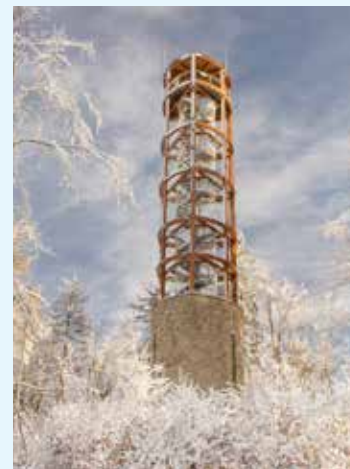
Rohledna Mařenka, foto: Petr Ondráček

prochází mostem přes umělý vodní kanál, přes jírovcovou alej až na Ostrý dvůr. Barokní sochy ukrývá město Hrotovice. Přímo v obci najdete sochy sv. Františka z Pauly, sv. Jana Nepomuckého, sv. Vendelína nebo sv. Donáta. V Hrotovicích lemuje cestu k soše sv. Floriana, patrona hasičů, téměř kilometrová alej lip a javorů, další ze selfie míst. Okolní krajině dominuje monumentální barokní kostel sv. Linhart. Jednoduchý kostel byl postavený Matyášem Kirchmayerem z Kdousova. Ke kostelu přiléhá fara, sýpka a hospodářský dvůr, které tvoří barokní celek. Kirchmayer je také autorem kostelů ve Slavíkovcích, Dobré Vodě a synagogy v Polici. Vesnická stavení v jižní části Třebíčska mívají nádech jižní Moravy. Jednu takovou pohádkovou vesničku najdete nedaleko Moravských Budějovic.