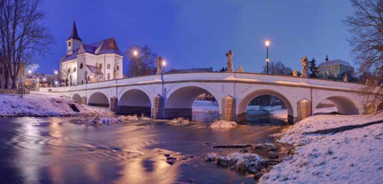
Náměšť nad Oslavou, foto: Ivo Svoboda