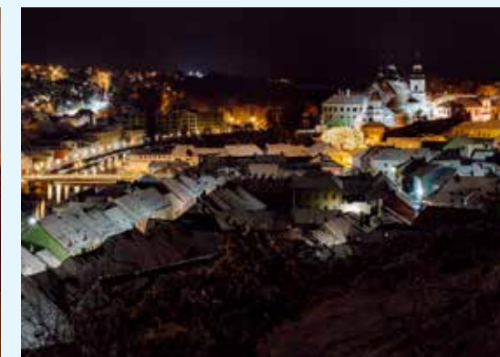
Noční Třebíč, foto: Pavel Rybníček

vás celým dnem. Děti se zabaví během tvořivých dílniček. Obě synagogy v Třebíči zastupují typ městské modlitebny. Pro srovnání si udělejte výlet do Police u Jemnice. Objevíte tady unikátní typ venkovské synagogy. Podobnou nenajdete v celém Česku. Synagoga je přístupná celoročně.