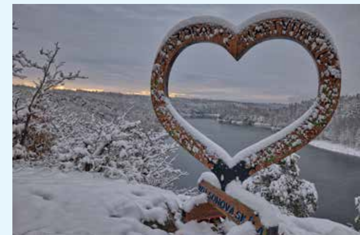
Srdce na Dalešické přehradě

Ta se pyšní od roku 2003 zápisem mezi památkami UNESCO, stejně jako celý areál bývalého benediktinského kláštera, židovská čtvrť a židovský hřbitov. Turistická oblast od Náměště nad Oslavou po Jemnici nabízí různorodé vyžití od jara do zimy. Se zimou přichází nejkrásnější část roku - advent. Ochutnejte Třebíčsko všemi smysly: gastronomie, památky, tradiční akce, krásná příroda. Vydejte se poznat tuto moravskou část Vysočiny a zamílujte si to u nás i v zimě.