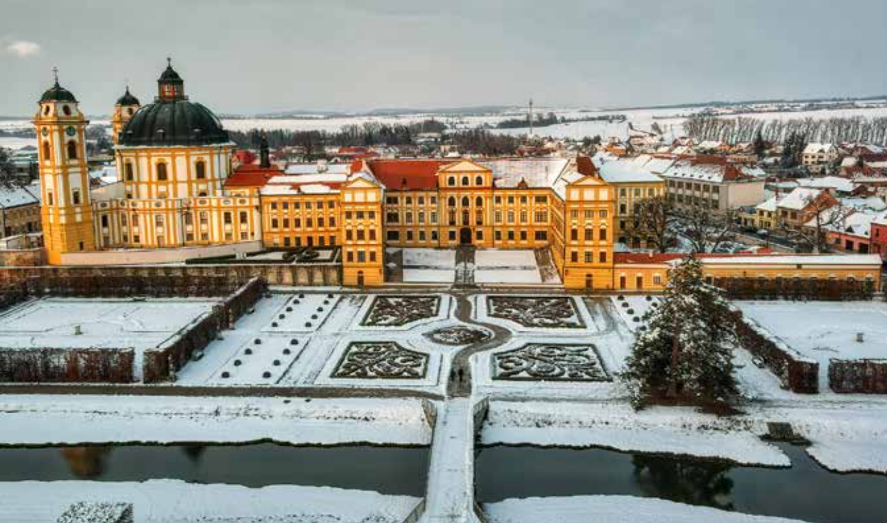
Zámek Jaroměřice nad Rokytnou