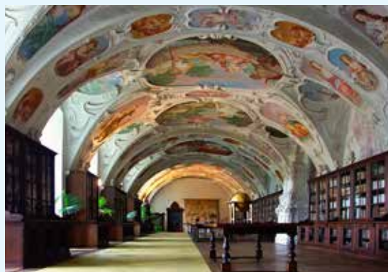
Zámek Náměšř nad Oslavou

koblihy. A jak oslava takového svátku vypadá, zjistíte, když se 11. prosince vydáte do Třebíče na kostymované prohlídky. V Zadní synagoze a Domu Seligmanna vás přivítají Bauerovi a provedou