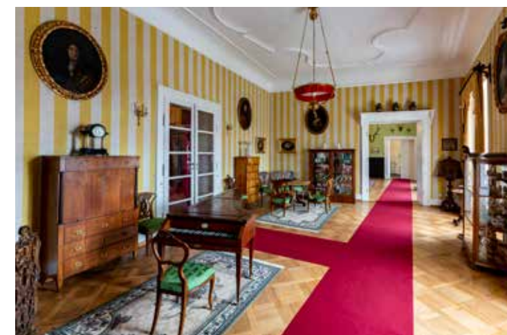
Moravské Budějovice, foto: Roman Šulc