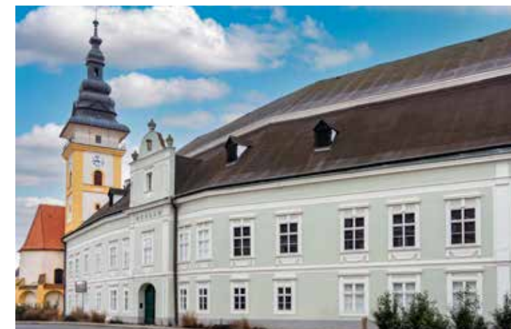
Moravské Budějovice, foto: Roman Šulc

Jemnice je jedním z nejstarších měst na Moravě. Jméno jí dali horníci – jamníci. Z někdejší hornické osady vyrostlo královské město. Při tažení na Moravu zanechal ve městě chráněném hradbami svoji manželku český král Jan Lucemburský. Onou ženou byla Eliška Přemyslovna, od krále dostávala zprávy. Postupně do města přibíhali čtyři běžci. Tato událost se stala základem historické slavnosti Barchan, jedné z nejstarších ve střední Evropě. Koná se vždy po svátku sv. Víta, třetí týden v červnu. Staňte se svědky běhu o Barchan, těšit se můžete na velký historický