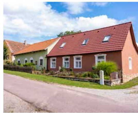
Police u Jemnice, foto: Roman Šulc

Svezte se vlakem do Rávcovic a po modré turistické značce se vydejte na putování do vesnické památkové rezervace Dešov. Už od Rávcovic vás upoutá kostel sv. Petra a Pavla ve Vysokém Újezdě. Byl vystavěn v 19. století a společně s ním fara a zemědělská usedlost. Vaší pozornosti neujde velká dřevěná socha učitele naproti kostelu. Jedná se o jednu ze soch moravskobudějovického řezbáře Jindry Sádovského. Najdete je nejen v okolí Moravských Budějovic a Jemnice, ale takřka po celé naší zemi. Polní cesta