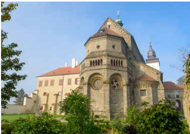
Románsko-gotická bazilika sv. Prokopa se stala symbolem města

Jediný větrný mlýn v České republice, který využíval energii větru na drcení kůry, najdete právě v Třebíči. Rozdrcenou kůru používaly místní koželužské dílny na vyčínění kůží. Zchátralou stavbu město Třebíč zrekonstruovalo v loňském roce. Mlýn je přístupný pro veřejnost od června do srpna kromě pondělí každý den od 9 do 18 hodin. Vnitřní expozice vás seznámí s tradičním trebičským řemeslem – koželužstvím i obuvnictvím.