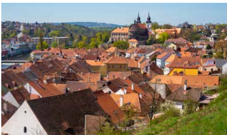
Třebíč byla zapsána na Seznam světového kulturního dědictví UNESCO v roce 2003

V kostýmech a s dobovými příběhy vás provedou průvodci bazilikou sv. Prokopa. Těšit se můžete také na víkendové programy se šermíři, divadlem a ukázkami židovské hudby i tance. Než dorazíte na další kostýmovanou prohlídku synagogy a domu Seligmanna Bauera, můžete se v židovské čtvrti zastavit na domácí zákusky, zmrzlinu, výbornou kávu, legendární limonádu ZON, ochutnat trebičskou čokoládu, plnoletí také trebičskou whisky či košer víno.