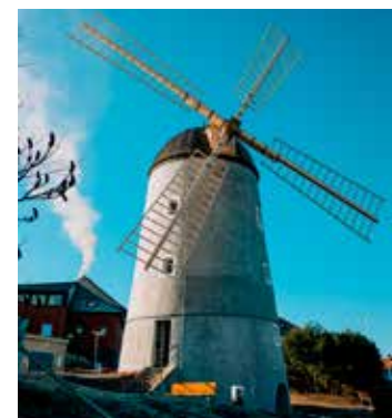
Třebíč se může pochlubit dalším unikátem: nově zrekonstruovaným větrným mlýnem na drcení kůry

Cestu Václava Vlastníka o délce 49,5 km, značenou žlutou turistickou značkou, lze projít kolem Třebíče z Vladislavi přes Mikulovice,