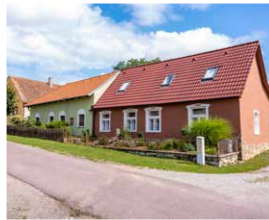
Židovská ulice v Polici