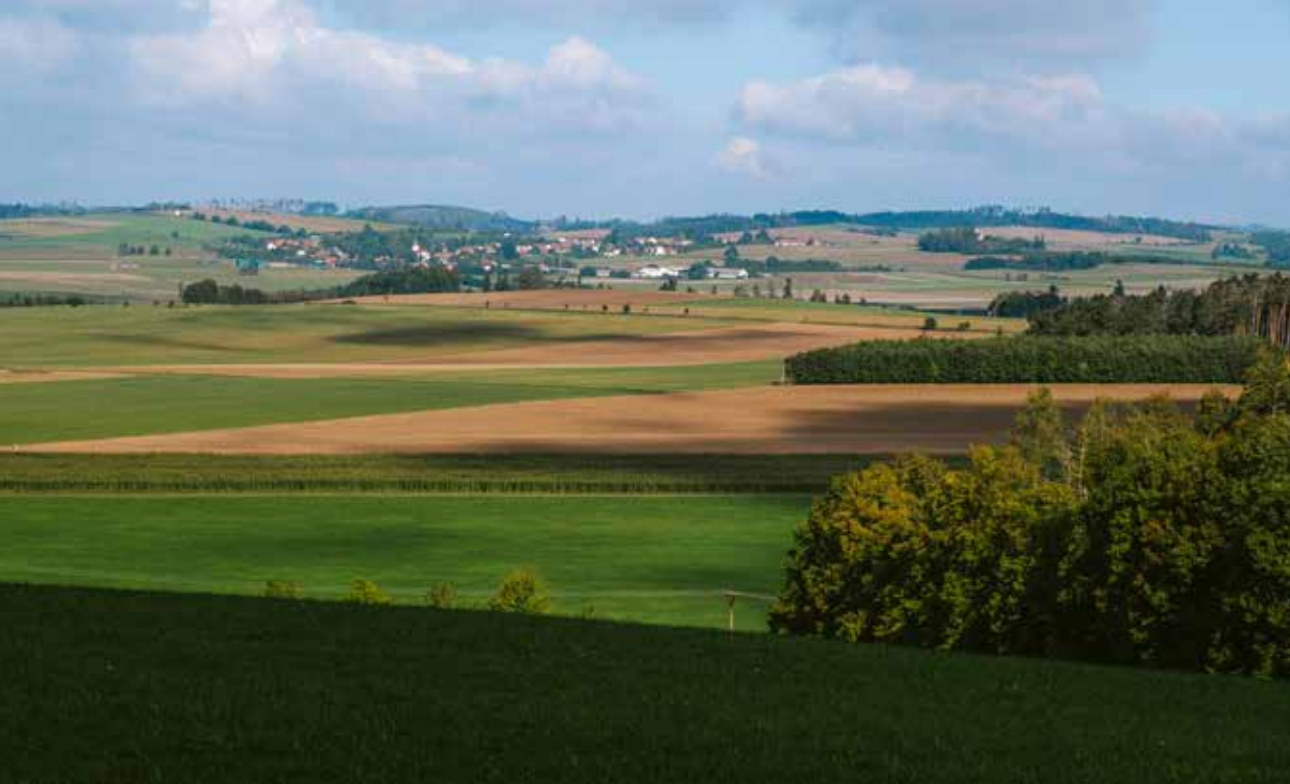
Krajina Jemnicka