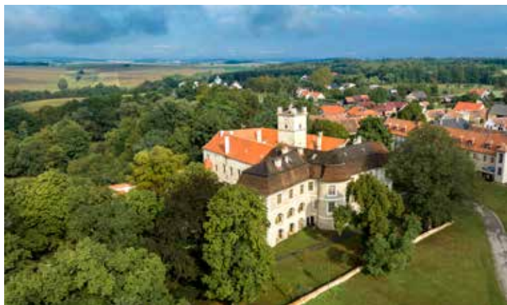
Police u Jemnice, foto: Roman Šulc

jako projev vděku nejprve vyrobit sochu Panny Marie a následně postavit i celou kapli. Druhé mariánské poutní místo leží ve vesnici Kostníky. Kostel je ukrytý na návrší Hájek mezi lipami. V době jejich květu je procházka kolem kostela neodolatelným zážitkem. Několikrát do roka zde probíhají trhy a jarmarky. V kostele jsou pohřbeni příslušníci rodu Vražďů z Kunvaldu, posledních majitelů zámku v nedaleké Polici. V Polici nezapomeňte navštívit synagogu, unikátní venkovskou modlitebnu. Najdete ji v Židovské ulici, jedinečně zachovaném ghettu se hřbitovem.