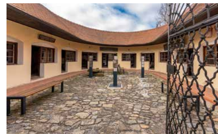
Masné krámy v Moravských Budějovicích