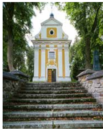
Kaple v Dobré Vodě